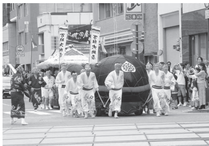
万屋町の「鯨の潮吹き」(10月9日)

長崎人は、笛と太鼓のシャガリの音を聞くと、心はときめき仕事も手につかないとか・・・。