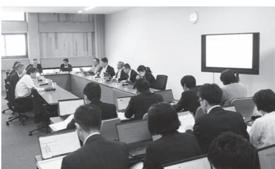
子育て支援特別委員会 (9月19日)

子育て支援特別委員会は、人口減少が本市の大きな課題となっている中、課題解消の一助となるよう、子育てしやすい環境を整え、子育て世帯に選ばれ、子育てしたくなるまちを目指すための施策の推進に寄与することを目的に設置されている。調査方針は、本市が実施している子育て支援の現状を把握し、本市の子育て世帯の満足度を向上させるための諸方策について、調査、検討を行っている。調査項目は、 7月 調査項目・方針、開催計画などの確認 8月 妊産婦への支援について 9月 乳幼児の支援について 10月 行政視察(東京三鷹市、愛知県豊橋市など) 11月 課題を抱えた子ども等への支援について 12月 総括質疑について 令和6年1月 調査報告書のまとめについて