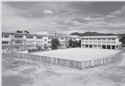
西町小学校校舎・グラウンド

：1億8,290万円 材料費の価格高騰等に伴い事業費を増額するもの。 ・現計予算額 9億8,330万円