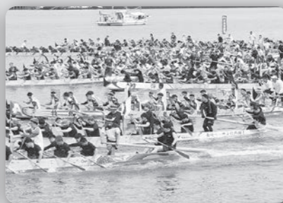
長崎ペーロン選手権大会 (7月30日 長崎港内)