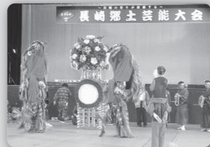
第46回長崎郷土芸能大会 (10月1日 長崎市民体育館)