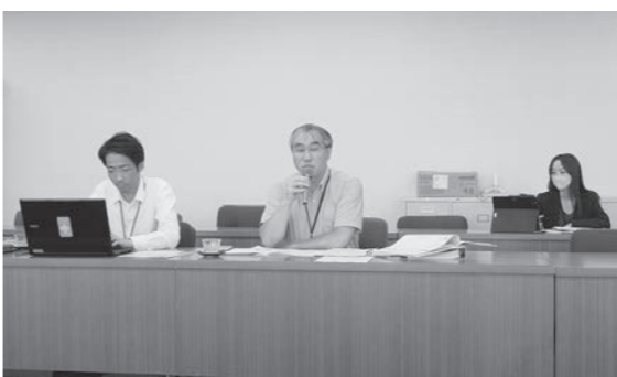
豊橋市役所への調査 (10月6日)