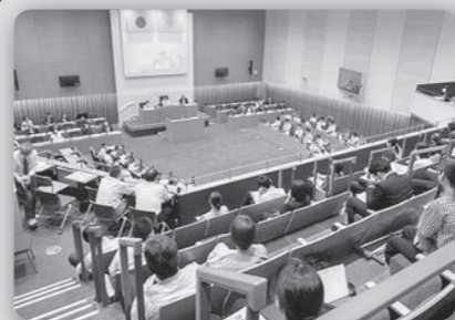
長崎市中学生議会 (8月17日 市議会議場)