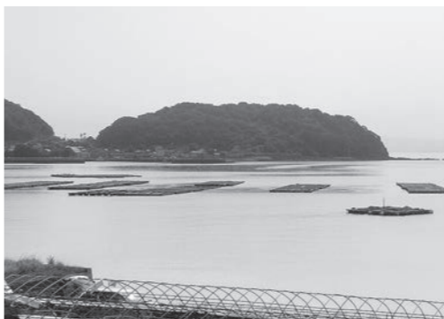
深刻な被害を受けた橘湾牧島町養殖業