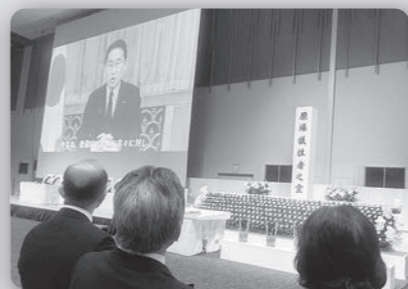
原爆犠牲者慰霊平和記念式典 (8月9日 出島メッセ長崎)