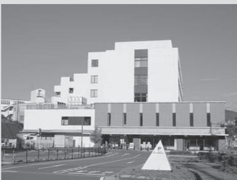
重工記念長崎病院