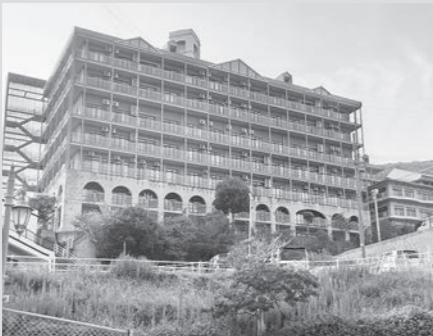
高齢者福祉施設稲佐の森シンフォニー

：1億5,041万4千円 入所系 7,367人分 通所系 244施設 訪問系 480施設