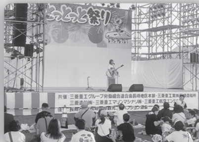
2023とっとと祭り (8月27日 長崎水辺の森公園)