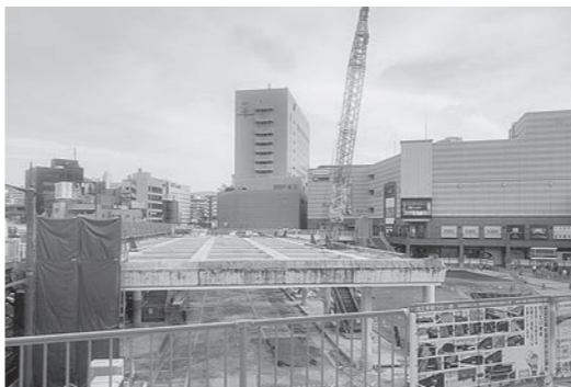
長崎駅前高架広場撤去工事

高架広場撤去工事において、高架広場の桁・階段・支柱部分の鋼材の塗膜材に含まれていたPCBの除去作業に係る経費を増額するもの。 ・現計予算額 14億6,040万円