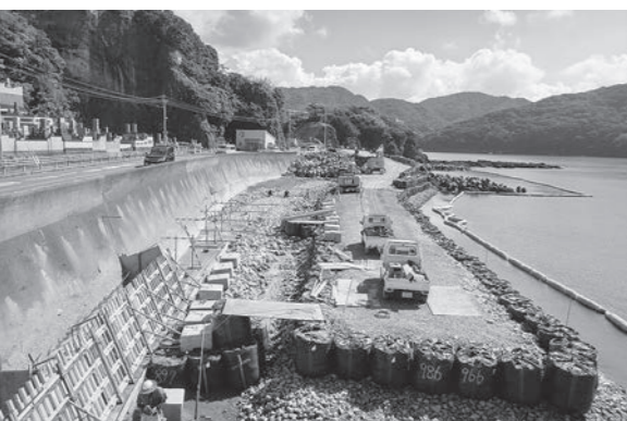
国道202号本町工区道路拡幅工事 (9月27日)