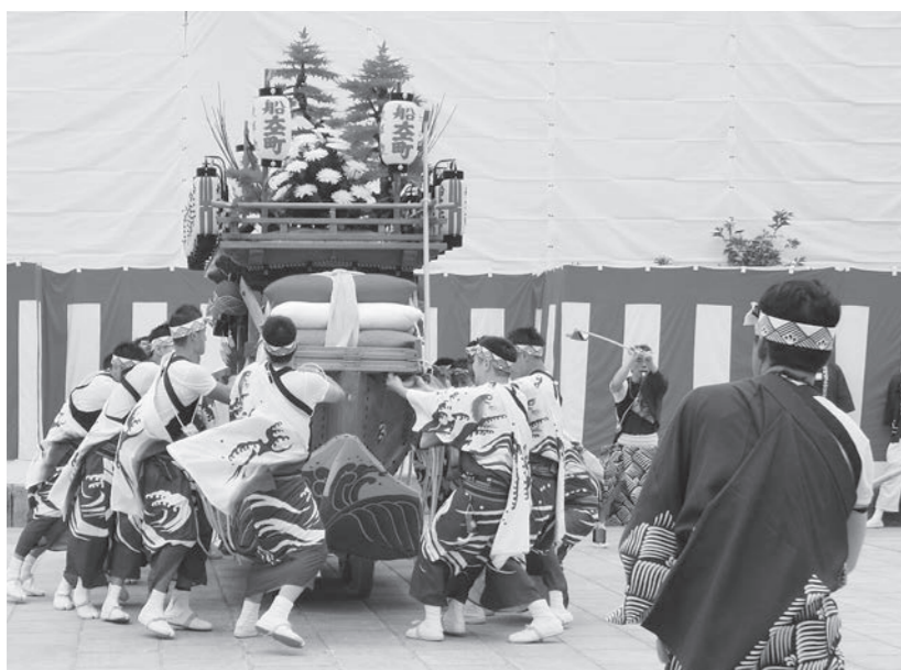
船大工町の「川船」(10月7日)

1634年(寛永11年)から続く、389年の伝統と歴史を誇る諏訪神社の秋の大祭「長崎くんち」は、中日(8日)の奉納踊りは雨天のため順延になったものの、10月9日無事閉幕しました。庭先回りでは、根柢衆が豪快に船を引き回す「川船・御朱印船・鯨の潮吹き」、コミカルに掛け合い軽快に舞った「阿蘭陀万歳」、鮮やかな「本踊」などが披露され、異国情緒あふれる音色などに市民や観光客は魅了されました。