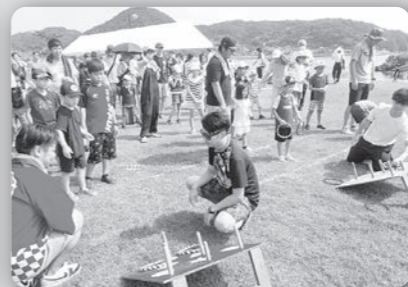
ファミリーフェスタ2023 (9月10日 結の浜マリナーパーク)