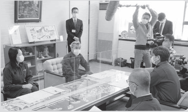
長崎市長へ新型コロナウイルス感染症対策要望書提出 (令和3年2月2日 市長応接室)