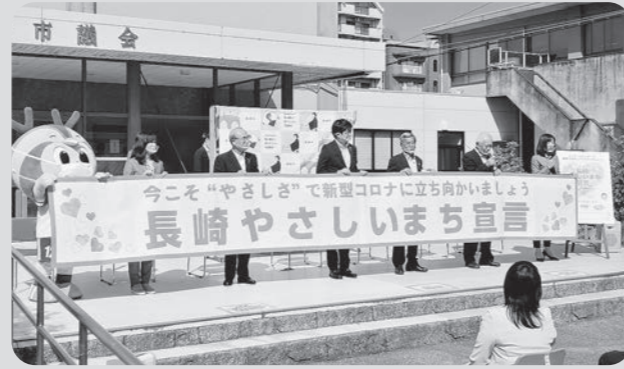
長崎やさしいまち宣言キックオフイベント (令和2年10月27日 旧市役所横西側広場)