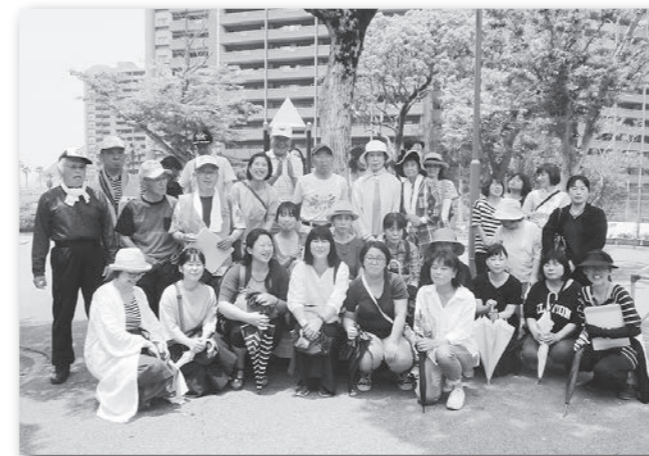
子どもを守るネットワークパトロール (令和元年6月12日)