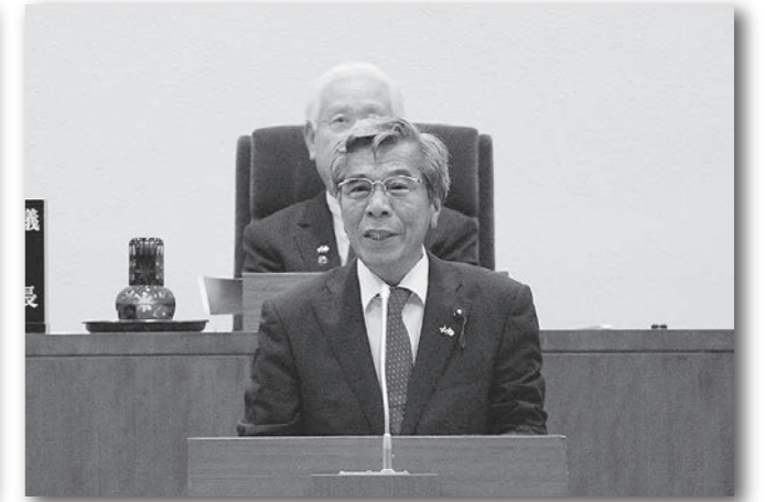
一般質問21回目の登壇 (令和2年9月9日)