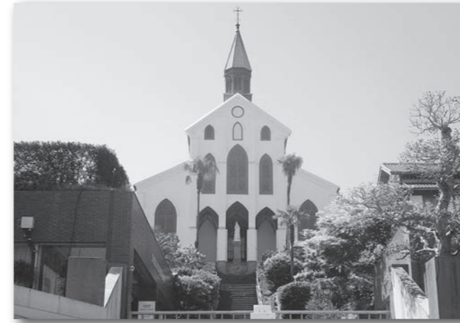
コロナ後の観光振興について (国宝大浦天主堂、令和2年4月16日)