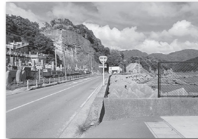
国道202号福田本町丸木墓地付近の道路整備 (令和4年6月28日)