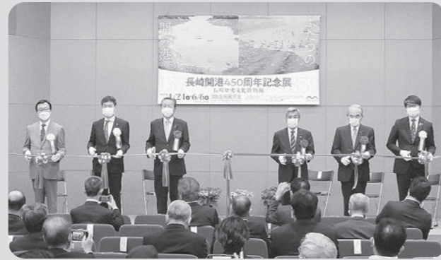
長崎開港450周年記念展～ふたつの開港～の開会式 (令和3年4月23日 長崎歴史博物館)