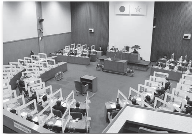
コロナ禍の定例会本会議 (令和3年3月19日)