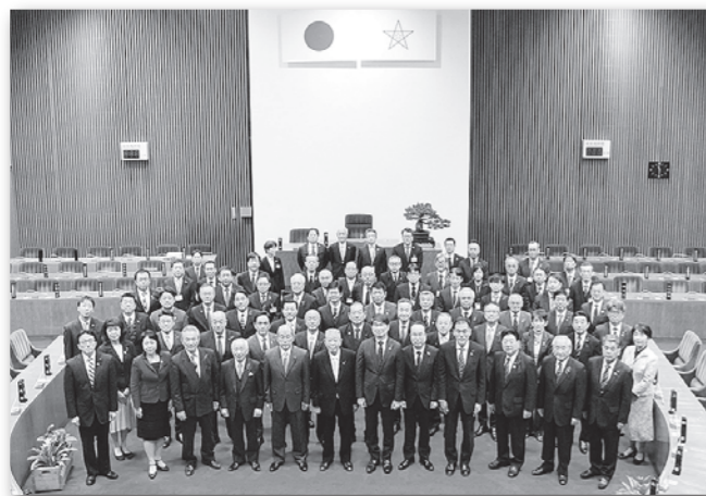
64年の歴史を閉じる市議会閉場式 (令和4年12月9日)