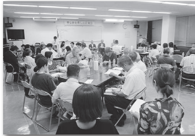
福田小学校区コミュニティ連絡協議会設立総会 (令和元年9月30日)