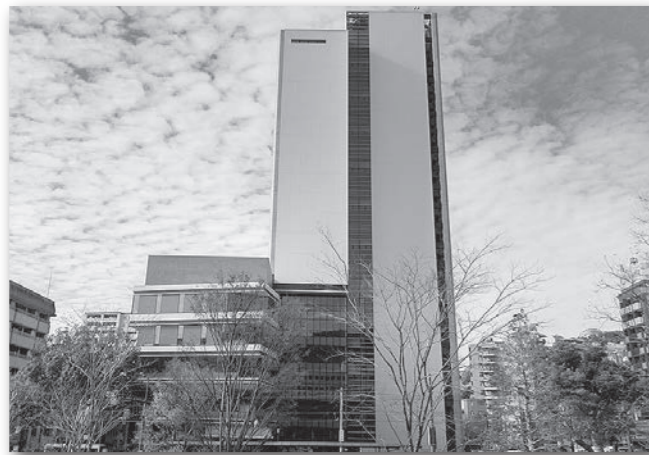
長崎市新庁舎 市議会議場は5階、傍聴席は6階 (令和5年1月4日開館)