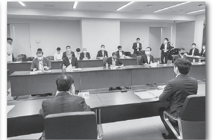
4協議会長崎県・県議会議長へ要望活動 (令和2年8月18日)