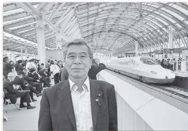
西九州新幹線かもめ歓迎セレモニー (令和4年5月10日)