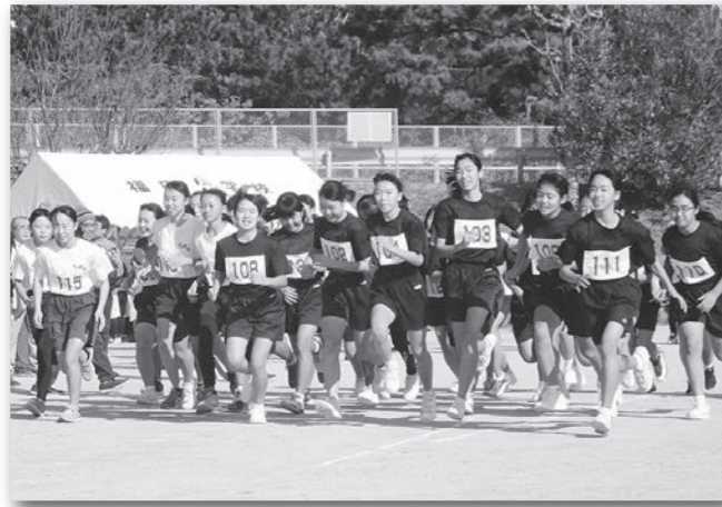
福田中育成協 第21回福田ロードレース大会 (令和元年12月8日)