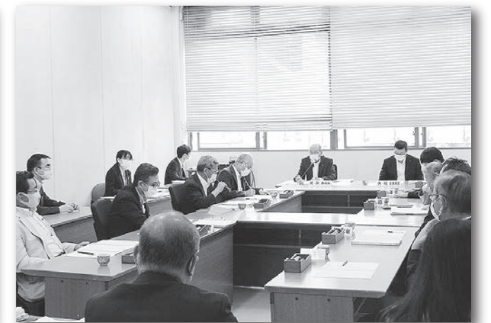
安心安全な地域づくりを目指して (令和2年8月26日)