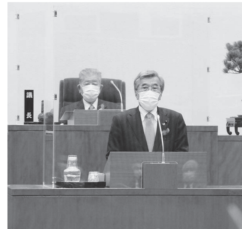
井上議長退任挨拶(令和4年3月11日)