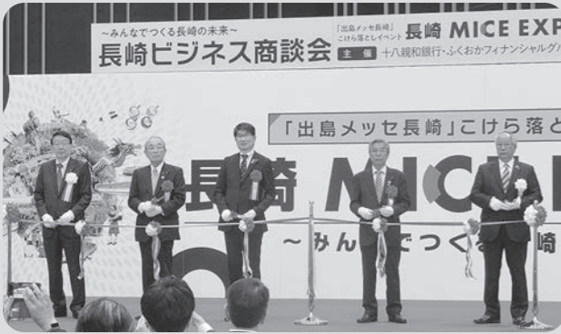
出島メッセ長崎こけら落とし (令和3年11月12日 出島メッセ長崎)