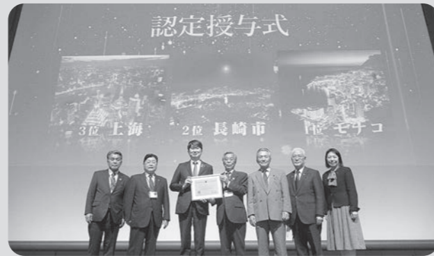
世界夜景サミットin長崎にて世界新三大夜景再認定 (令和3年11月19日 出島メッセ長崎)