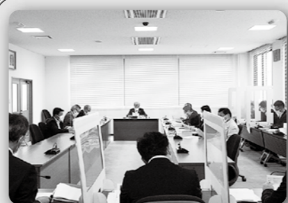
長崎市議会コロナ対策会議(5月25日 市議会棟)