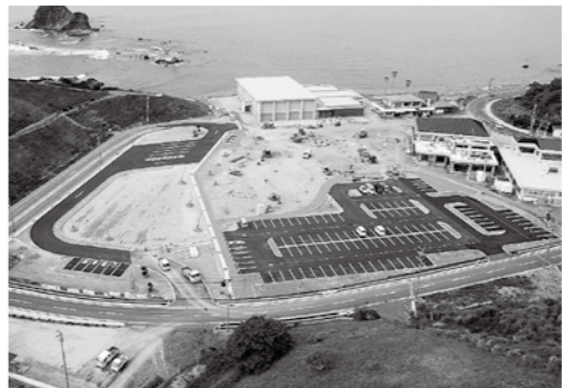
長崎市恐竜博物館10月29日に野母崎にオープン!