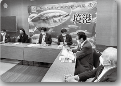
特定第三種漁港協議会(7月8日 境港水産物地方卸売市場)