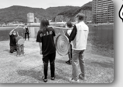
大浜町川祭り(コロナ収束祈願)(6月6日 大浜町海岸)