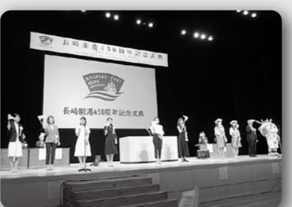
長崎開港450周年記念式典(4月27日 長崎ブリックホール)