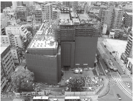
長崎市新庁舎建設工事(東側)