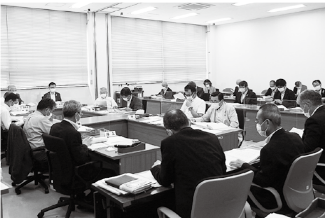
7月2日・5日閉会中の総務委員会にて長崎市第5次総合計画「前期基本計画」の所管事項調査