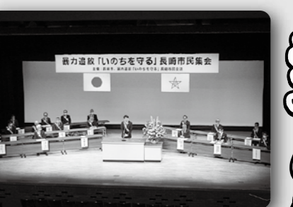
「いのちを守る」長崎市民集会(4月17日 長崎市民会館)