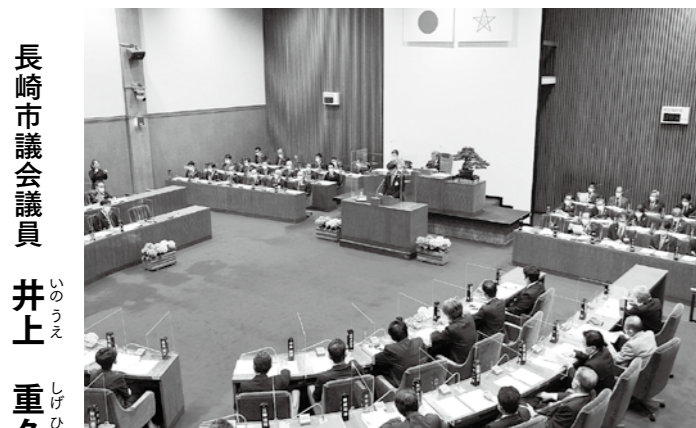
長崎市議会定例会開会(令和3年6月11日)