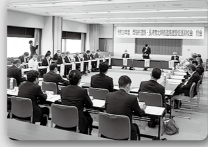
西彼道路・長崎南北幹線道路建設促進期成会総会(7月12日 長崎県農協会館)