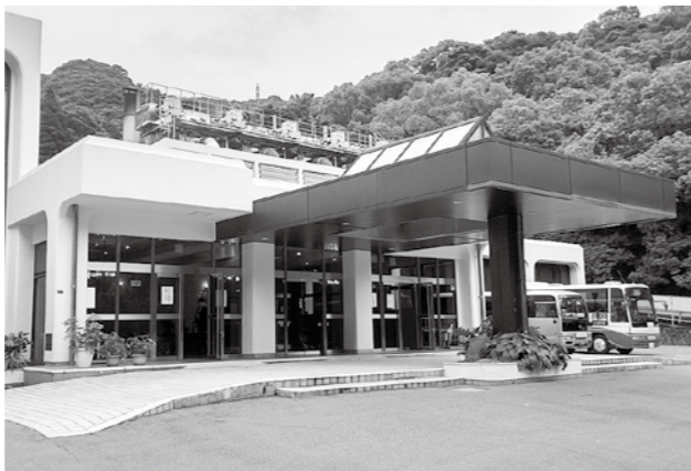
年間約5,800件の火葬を行う、もみじ谷葬斎場

新庁舎移転とあわせ、市民サービスの向上及び職員の入力作業の削減と効率化を図るため、総合窓口システムを構築するもの。