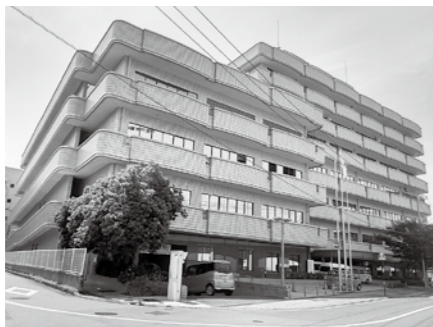
もりまちハートセンター内にある障害者福祉センター

障害福祉センター診療所において増加する発達障害児等に対して療育を行う訓練室が不足しているため、療育に従事する専門スタッフが十分稼働できるように、訓練室を増やす改修工事を行い、診療所の機能強化を図るもの。