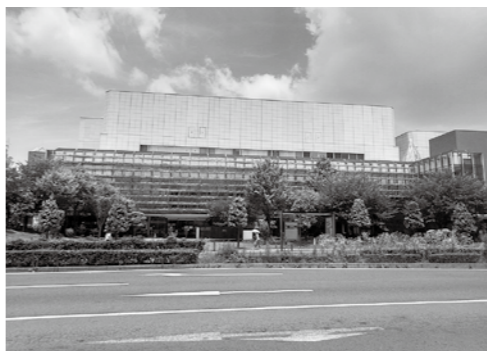
4月14日から長崎市電子図書館のサービス開始!

「新しい生活様式」に対応するため、スマートフォンやタブレット端末、PC等の機器で利用できる商用電子書籍を整備するもの。