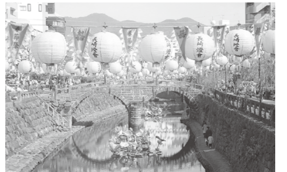
眼鏡橋のランタン 9月29日からライトアップ

◆野母崎田の子地区再整備 …7,900万円 野母崎田の子地区再整備事業に併せ、旧野母崎福祉保健センターを休憩施設として活用するため、建物の改修工事を行うもの。 実施により、周遊しながら装飾を楽しめる長崎型の新たなイベントスタイルに作り変えるための経費を増額するもの。