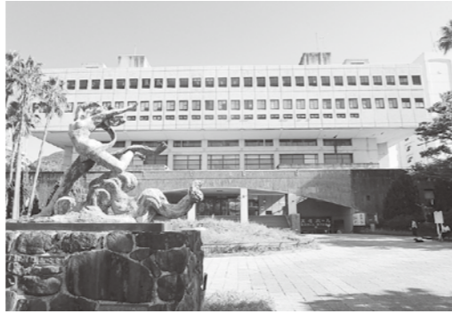
市民会館 空調設備の整備