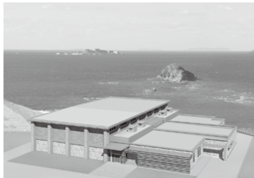
長崎恐竜博物館 令和3年10月オープン