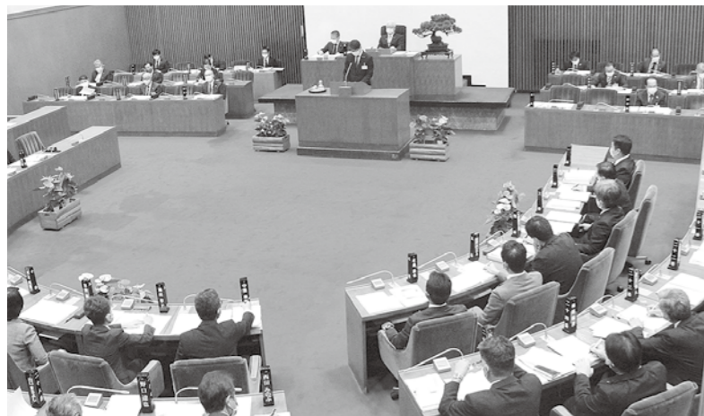
マスク着用の9月定例会本会議(令和2年9月10日)