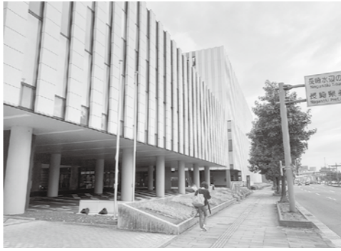
長崎メディカルセンターへ運営資金を貸付