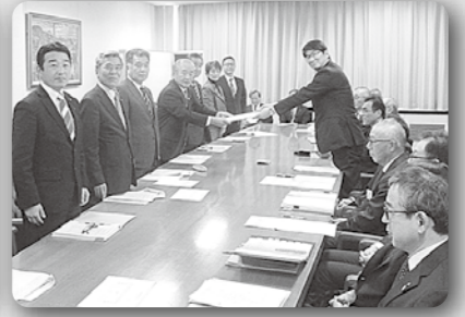
市民クラブ政策要求の回答を受ける (令和2年2月5日、長崎市役所)