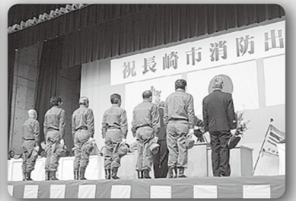
長崎市消防出初式 (令和2年1月7日、市民会館)