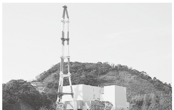
令和2年度に煙突解体(旧西工場焼却場)

回答：子どもたちが恐竜に関心を持つ取り組みとして、小中学校の教育活動と関連した学習活動、発掘体験やレプリカ作成体験など、体験メニューの整備を行うこととしている。 質問：旧西工場焼却場の跡地活用は? 回答：旧西工場は、煙突を解体するとともに、管理棟は川口町にある中央環境センターの事務所とする。工場棟は建物を残したまま内部機器を撤去し、ストックヤードやごみ収集車の車庫として活用する。