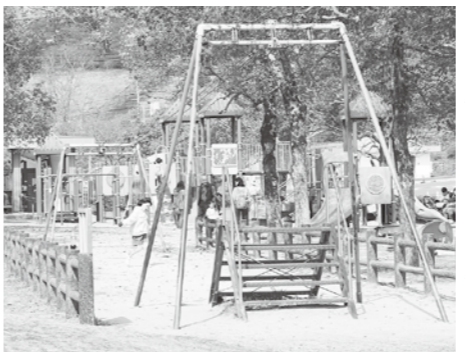
遊具点検マニュアルにて点検を実施

回答：新大工町地区は、南街区が令和2年内、北街区は令和4年内の完成予定となっている。また、当事業では、2つの都市計画法上の手法を用いて、指定容積率が400%から600%のところを一律700%まで緩和している。 浜町地区は、平成30年度に推進計画書を見直し「浜町地区まちづくり方針」を策定し、事業の実現に向けた取り組みが進められている。長崎市としても引き続き、都市計画制度を活用した必要な容積率の緩和など、事業の実現に向けた支援を行っていく。