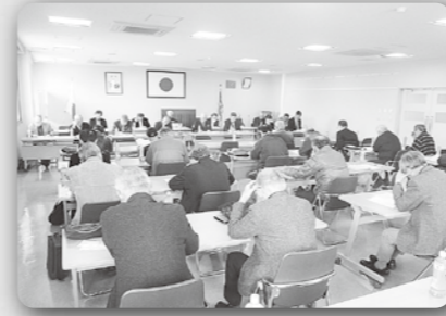
稲佐地区防犯協会解散総会 (令和2年3月19日、稲佐警察署)