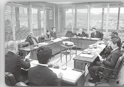
金沢市役所にて調査 (令和2年1月27日、金沢市役所)