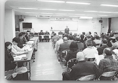
福田バイパス建設促進期成会総会 (令和2年2月14日、福田地区公民館)