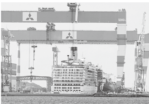
三菱重工香焼トッポのクルーズ船メンテナンス

者に対する技術・伝承や中堅技能者を対象とした人材育成、優れたもの認証制度による販路開拓と拡大、産学連携による新製品・新技術の開発、新事業展開や生産性向上を支援することにより、造船業を始めとするものづくり企業の事業環境変化に対応した競争力強化を支援している。 また、クルーズ船修繕事業への参入については、長崎市が事務局となり、国や県、経済団体などで構成する「長崎港におけるクルーズ船修繕事業の拠点化に関する関係機関連絡調整会議」を設置し、環境整備を進めている。