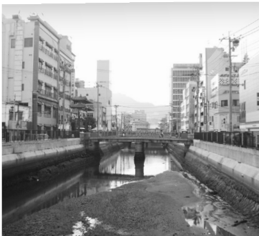
銅座川周辺(県営銅座駐車場跡)

…4,500万円 銅座川ふれあいの水辺整備事業として、賑わいのあるまちづくりを推進するため、環境整備事業を行う。 事業期間…平成20年度 整備内容…護岸修景、広場整備ほか