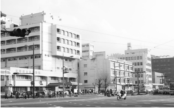
地域医療の拠点となる新市立病院の建設事業に着手!