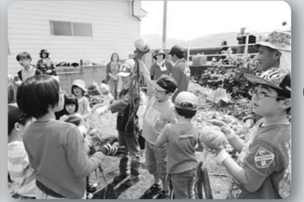
イモレンジャー「玉ねぎ収穫」 (平成29年4月29日、福田本町)