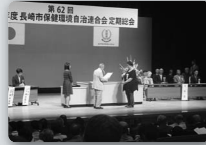
保健環境自治会連合会総会 (平成29年7月4日、長崎市民会館文化ホール)