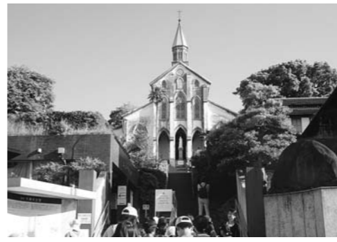
観光動向の現地調査 (5月22日)