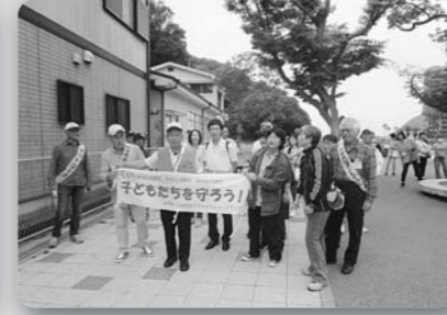
子どもを守るネットワーク (平成29年6月21日、福田地区4箇所)