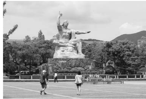
原爆犠牲者慰霊平和祈念式典会場の平和公園整備