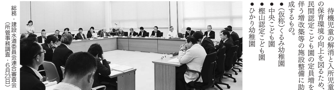
総務・建設水道委員会連合審査会(所管事務調査・6月23日)