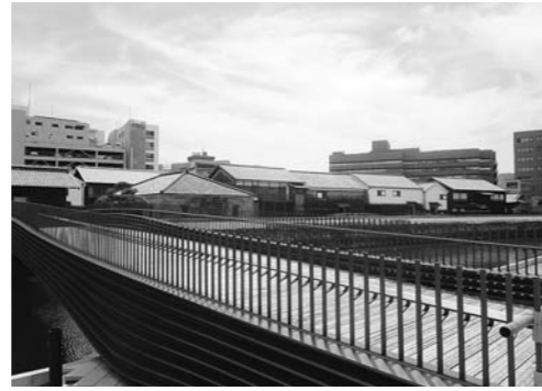
出島エリア ライトアップ整備