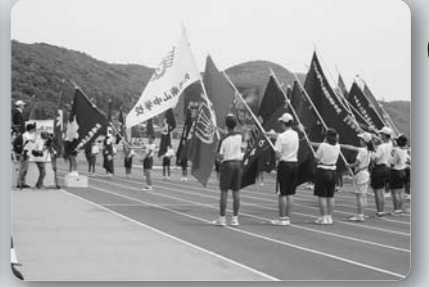
長崎中学校総合体育大会開会式 (平成29年6月10日、かきどまり陸上競技場)