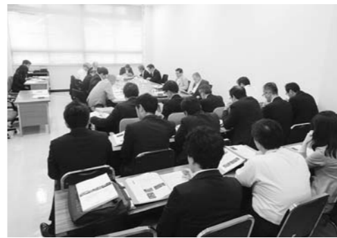
観光客受入対策特別委員会 (6月26日)