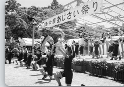
第13回神の島公園あじさい祭り (平成29年6月4日、神ノ島公園)