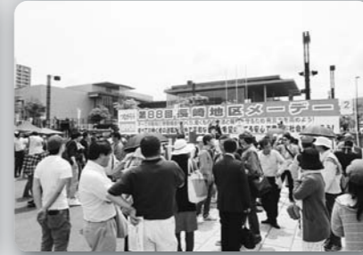
第88回長崎地区メーデー (平成29年5月1日、出島ワーフ横三角広場)