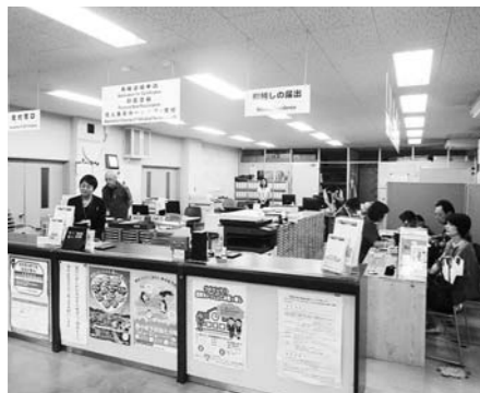
滑石支所現地調査(6月22日)