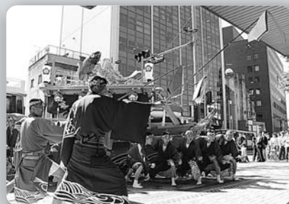
長崎くんち庭先回り「廻屋町(川船)」 (平成26年10月8日、NBC玄関前)