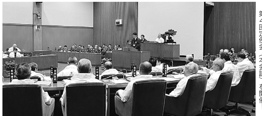
国体ジャンパーを着用して第4回定例会（本会議）を開催！

球菌予防接種が定期接種の対象となったことに伴い、予防接種に必要となる経費を計上する。 ・対象者 65歳の者及び60歳以上65歳未満の者であつて、心臓、腎臓若しくは呼吸器の機能又はヒト免疫不全ウイルスによる免疫の機能に障害を有する者 自己負担額…2,000円 ◆定期予防接種費 ……1億1,202万3千円 予防接種法施行令の一部改正により、乳幼児の水痘予防接種が定期接種の対象となったことに伴い、予防接種に必要となる経費を計上する。 ・対象者 生後12月以上生後36月末満の者（2回接種） 自己負担額…なし ◆ごみ最終処理費 三京クリーンランド土地明渡等請求事件和解金等 ……3億2,780万円 平成21年度の三京クリーンランド埋立処分場に係る土地明渡等請求事件につい