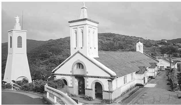
平成28年世界遺産登録を目指す「出津教会」

◆旧野母崎町樺島火葬場解体費……640万円 旧野母崎町樺島火葬場解体費について、アスベスト及びダイオキシン対策が必要であることが判明したため、対策関連経費を計上する。 ◆支所機能整備費……1,200万円 平成27年1月から支所で取り扱う受付業務を拡充するため、各支所に必要な備品の整備や西浦上支所の待合スペース改修などに要する経費を計上する。 ◆世界遺産観光客受入費……390万円 「長崎の教会群とキリスト教関連遺産」の構成資産である「出津教会堂と関連施設」及び「大野教会堂」周辺に臨時駐車場及び仮設トイレを整備し、併せて警備員配置と誘導案内板設置を行う。 ◆世界遺産登録推進事業費 「長崎の教会群とキリスト教関連遺産」……850万円 世界遺産登録に向けて外海地区の受入態勢を整備するため、出津地区の駐車場及びトイレの実施設計を行う。 ◆市民プール施設整備事業費……1,250万円 【事業内容】経年劣化した照明操作装置の改修を行う。 【整備箇所等】市民総合プール