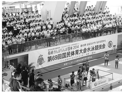
地元長崎の大応援団（水球大会） (平成26年9月9日、長崎市民総合プール)