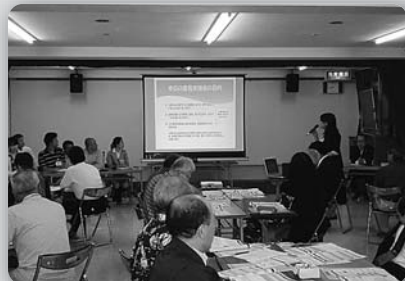
(仮称)長崎市よかまちづくり条例「意見交換会」 (平成26年10月2日、西公民館)

長崎の伝統行事「くんち」! 朝夕の冷え込みを感じながら晩秋を迎える季節となりました。皆様におかれましては、益々ご健勝にてご活躍の事と存じます。 長崎市諏訪神社の秋の風物「長崎くんち」は、3日間とも天候に恵まれ例年より人出も多く、シャガリの音とともに閉幕しました。庭先回りでは、根曳衆が豪快に引き回す廻屋町の「川船」、山車が宙に舞う銀屋町の「鯨太鼓」などが披露され、異国情緒あふれる音色などに市民や観光客は魅了されました。 各地域においては、五穀豊穡・ふるさとの繁栄や安全祈願等、奉納踊りや神事が執り行われ、それぞれの「郷くんち」として引き継がれています。