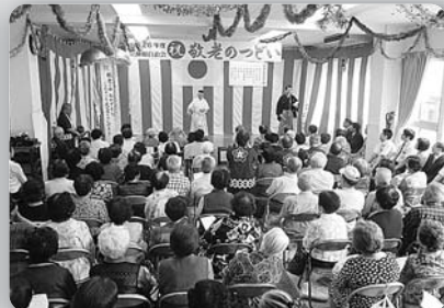
立神自治会敬老のつどい (平成26年9月15日、立神公会堂)