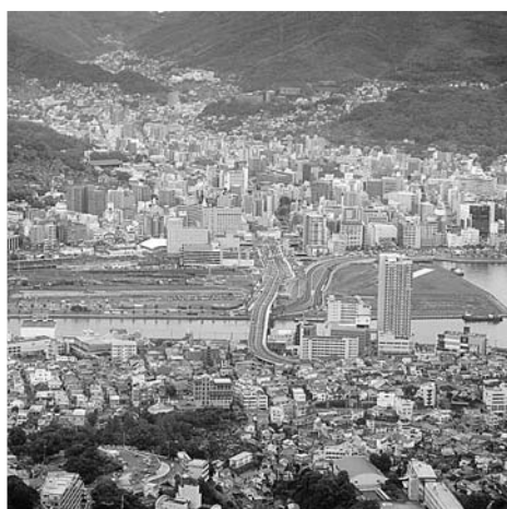
長崎駅周辺(MICE施設予定地)