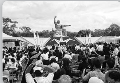
長崎原爆犠牲者慰霊平和祈念式典 (平成26年8月9日、平和公園)