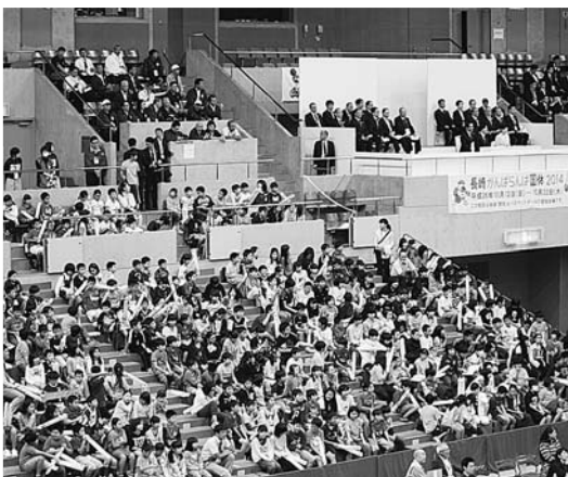
「長崎がんばらんば国体」少年男子バスケットボール決勝戦(平成26年10月22日、県立総合体育館)

「45年ぶりの長崎国体」は、各都道府県から監督、選手約2万1千人が参加、38競技で個人・団体戦で技が競われました。長崎市内には、市内外から約20万人が訪れ、長崎市実行委員(市職員)として約4,300人、市民ボランティア約2,100人が大会運営をサポートしました。また、それぞれの「おもてなし運動」で、国体が盛り上がり記憶に残る大会となった事と思います。