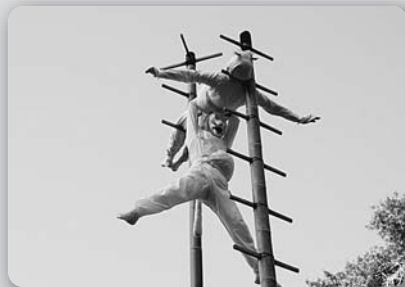
若宮稲荷神社の「竹ノ芸」 (平成26年10月15日、若宮稲荷神社)