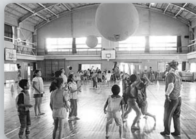
福田地区子ども会キンボール大会 (平成26年10月4日、福田小学校体育館)