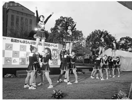
国体開催50日前イベント (平成26年8月23日、松山市宮陸上競技場)