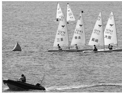
国体3日目、セーリング競技 (平成26年10月14日、長崎サンセットマリナー沖)

◆消防施設整備事業費 防火水槽整備ほか……700万円 世界遺産登録に向けた大野教会堂周辺の受入態勢整備として行う道路拡幅事業に伴い、支障となる防火水槽を移設整備する。