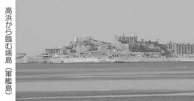
高浜から臨む端島(軍艦島)