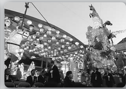
ランタンフェスティバル「春節礼祭および点灯式」 (平成26年1月31日、湊公園)