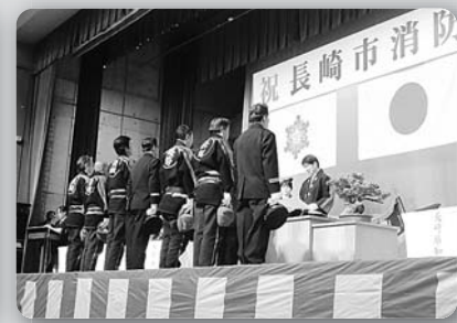
長崎市消防出初め式(表彰) (平成26年1月7日、長崎市民会館)