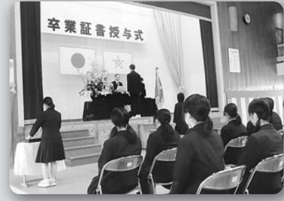
福田中学校第60回卒業証書授与式 (平成26年3月18日、福田中学校体育館)