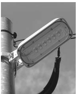
LED街路灯へ転換進む