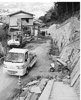
入船町8号線「車みち」整備事業