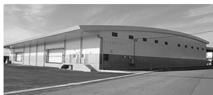
2月より供用開始した小ヶ倉柳樟の倉庫

長崎港活性化センターが、平成25年7月の厚労省より採択を受けた戦略産業雇用プロジェクト(ながさき海洋環境産業雇用創造プロジェクト)により、これまで以上に高度な技術・技能の習得や海外展開力強化など人材育成の底上げを行い、造船業をはじめとする本市製造業の雇用創造及び競争力強化を図る。