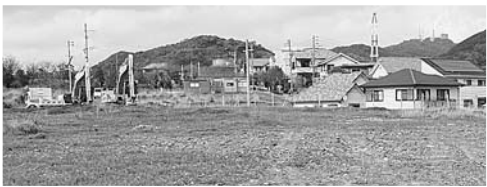
新小櫛小学校移転用地(長崎市みなと坂)