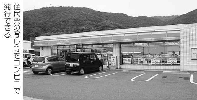
住民票の写し等をコンビニで発行できる