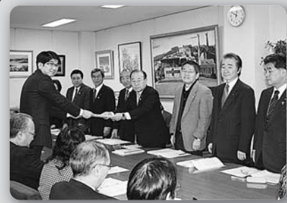
政策要求回答受ける (平成26年2月4日、長崎市役所応接室)

で、再発防止に取り組んでもらいたいものです。 長崎市の財政状況は、依然と厳しく行財政改革の推進や事業の見直し、厳しい財政運営のなかでの財源確保、税金の有効活用等、議会のなかで意見反映を行なっていきます。今後とも、皆様方のご指導・ご鞭撻をよろしくお願い申し上げます。