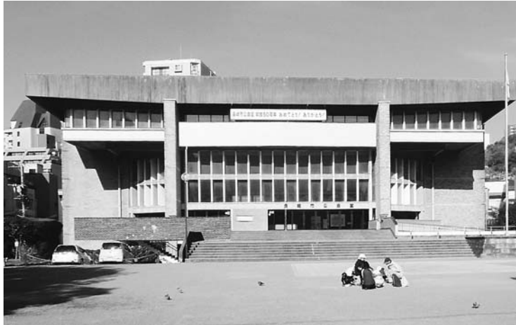
長崎市公会堂を廃止する条例「継続審査」!

平成26年4月 発行責任者 井上 重久 編集責任者 梅本 一由 長崎市水の浦町1-1 TEL095-861-6032