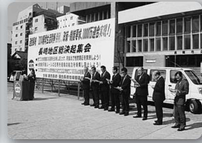
連合長崎地区総決起集会 (平成26年3月8日、長崎市公会堂前公園)