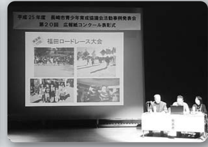
福田育成協活動事例発表 (平成26年2月15日、メルカつきまち)