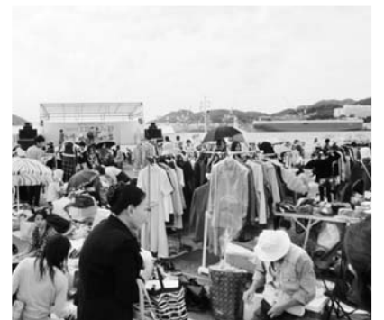
昨年のエコライフ・フェスタ(水辺の森公園)

平和公園の祈念像地区と中心地区のネットワークを強化し、安全で快適な歩行・滞留スペースを確保することにより、多くの市民