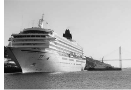
客船飛鳥II長崎入港(昨年10月29日)

中国・韓国など主に東アジア地域からの外国人観光客の増加を目的として、受入態勢の整備及び誘致活動など、「長崎市アジア・国際観光戦略」に基づく積極的な事業展開を図る。