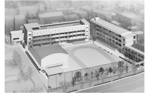
平成23年度事業で新校舎建設、既存公舎解体 事業期間:平成21年度~24年度「上長崎小学校」完成イメージ