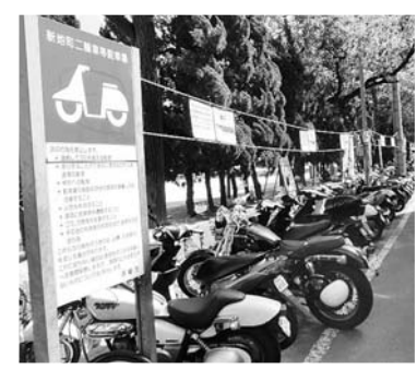
新地町二輪車等駐車場の整備、1日1回につき200円

長崎市二輪車等駐車場条例の一部を改正する条例 市内の民間駐車場との均衡等を勘案し、恵美須町二輪車等駐車場、新地町二輪車等駐車場及び魚の町二輪車等駐車場を有料の二輪車等駐車場として設置するのに伴い、その ・クラブハウス 132・99㎡ (島内観光案内、便所等) ・供用開始(仮称)伊王島大橋の開通日に合わせ供用開始