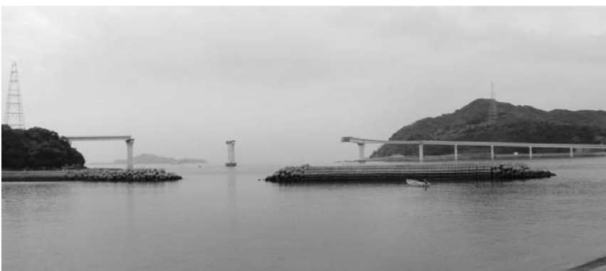
上側の写真は9月26日香焼総合公園展望台から撮影、下側の写真は伊王島側橋げた設置後9月15日香焼町辰ノ口海水浴場から撮影