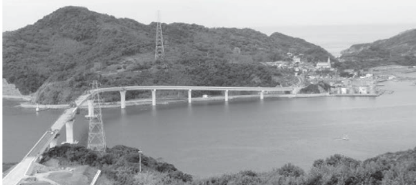
市中心部から伊王島までの所要時間は車で約30分程度になる