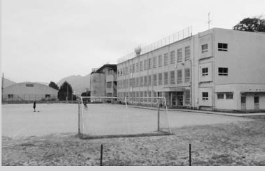
朝日小学校の雨もり修繕をはじめ延べ41校補修される

……735万7千円 長崎市の観光をテーマに、観光の魅力や長崎市の取組内容などを紹介するラジオ番組を放送する。 ・雇用者数3人(うち新規雇用者3人)