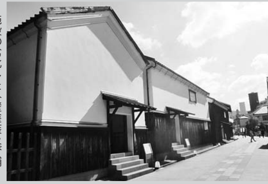
施設の劣化した外壁塗装及び舗装を補修する

……2,000万円 児童の安全性確保と教育環境向上のため、校舎、体育館等の雨漏りや屋外遊具を補修する。