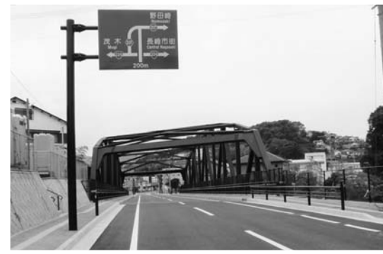
7月4日開通した小ヶ倉蛭茶屋線の絆橋付近

◆地方特定道路整備事業費 ……18,760万3千円 都市計画道路小ヶ倉蛭茶屋線の事業進捗に伴い、不足することとなった事業費を増額する。