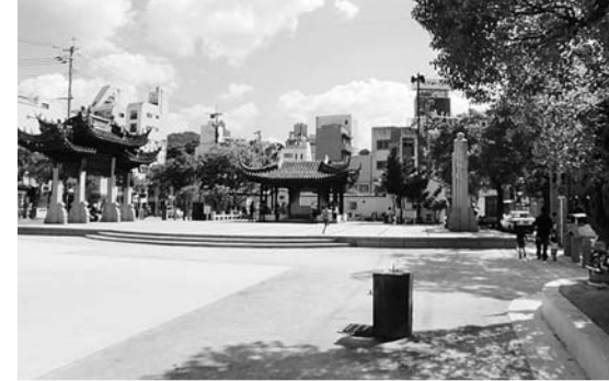
湊公園ほか3公園が整備される

……14,000万円 公園利用者の安全性・利便性を向上させるため、施設の再整備を行う。