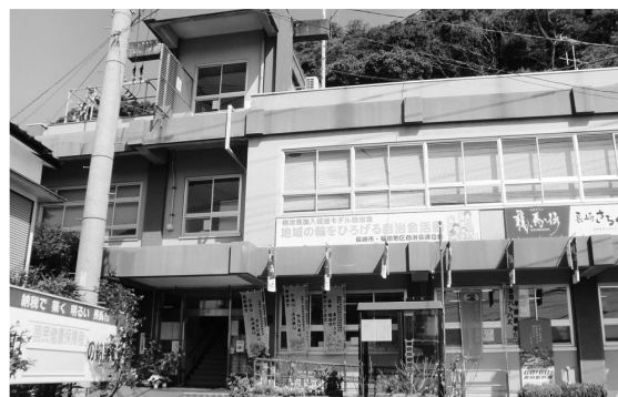
エレベーター設置が行われる福田支所

【単独】庁舎等施設整備事業費 : 1億9,500万円 利用者の利便性を向上するため、合同庁舎7ヶ所のバリアフリー化に向けたエレベーター設置工事を行うとともに、茂木支所ほか5ヶ所の公共下水切替工事を行う。 ◆エレベーター設置箇所 小ヶ倉・土井首・福田・深堀・茂木・式見・小榎の各合同庁舎