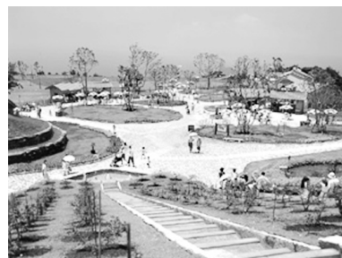
長崎いこいの里 あくりの丘エリア

▼4月は、子供達の入学式・企業の入社式など新たなスタートを迎えます。高校・大学等を卒業した新社会人の新しいスーツ姿、将来への夢と希望を持つての旅立ち！努力と我慢を忘れずに、一歩一歩人生を歩んでほしいものです。