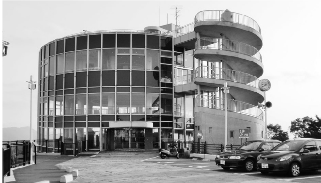
夜景の魅力向上のためリニューアルされる稲佐山山頂展望台

稲佐山山頂魅力向上プラン検討プロジェクトの検討結果を踏まえ、長崎の夜景観光の魅力を高める。