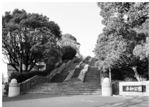
エスカレーター設置予定の平和公園入口

【単独】自治会集会所建設奨励費補助金 : 4,300万円 自治会集会所の増改築・補修等を行う場合の助成要