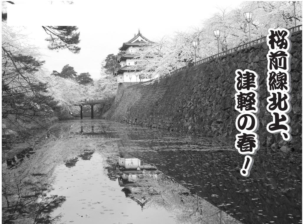
長崎の桜の開花宣言は平年より7日早い3月18日、写真は弘前公園の濠(こつ)に浮かぶ櫓(やぐら)と桜の花びら(写真撮影日:2009年4月22日)

長崎市の財政状況は、一般会計予算の歳入2,082億8,000万円に對し、自主財源は752億5,700万円(36.2%)となっており、国庫支出金533億