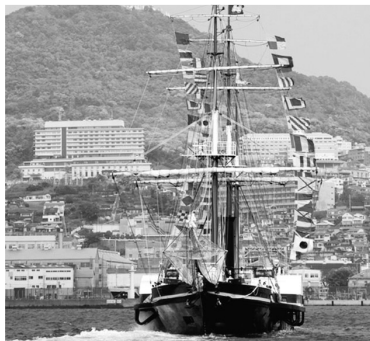
平成22年7月「海フェスタ」開催!

◆海フェスタ開催準備費負担金…300万円 平成22年7月の「海の日」を中心に開催予定の「海フェスタ」に係る会議費や事業費等の準備経費について負担する。