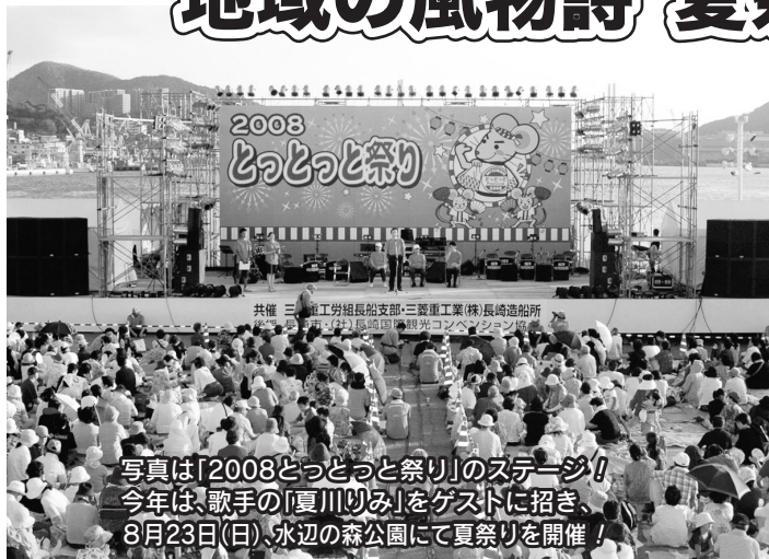
写真は「2008ととっと祭り」のステージ!今年も、歌手の「夏川りみ」をゲストに招き、8月23日(日)、水辺の森公園にて夏祭りを開催!