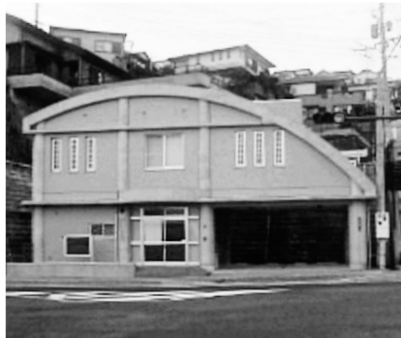
旧南が丘交番跡(南が丘町)

廃止された旧南が丘交番を地域の「安全・安心・交流センター」として活用するため整備する。