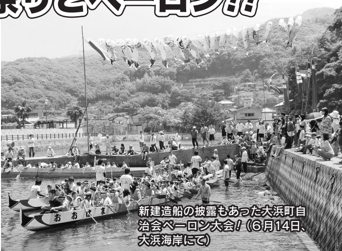
新建造船の披露もあった大浜町自治会ペーロン大会!(6月14日、大浜海岸にて)