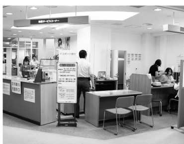
メルカつきまち4F消費者センター

長崎市民を対象とした、パスポート(旅券)発給申請受付及び交付の窓口を長崎市消費者センター(長崎市築町3-18、メルカつきまち4階)にて対応している。 《開設日》 発給申請受付は月曜日から金曜日9時~17時。受取りは月曜日から金曜日9時~17時、土曜日・日曜日・祝日は10時~18時。