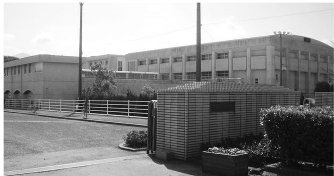
長崎市長立長崎商業高校建物に係る屋上防水改修を行う