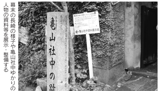
◆亀山社中跡地施設整備事業費 ……2,750万円