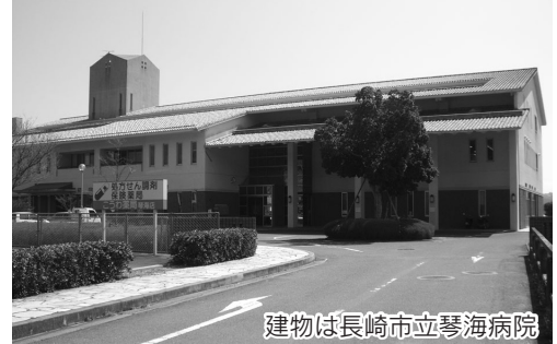
建物は長崎市立琴海病院

【要 旨】 経営状況等を総合的に勘案して民間移譲するのに伴い、野母崎病院及び琴海病院を廃止する。 【民間移譲の理由】 既存施設の有効活用を図り、患者のニーズに沿ったサービスの提供が期待できる。 【移譲の時期】 平成21年度中(予定)