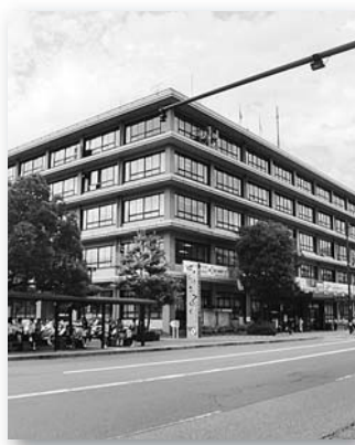
新市庁舎建設の着手時期検討中!