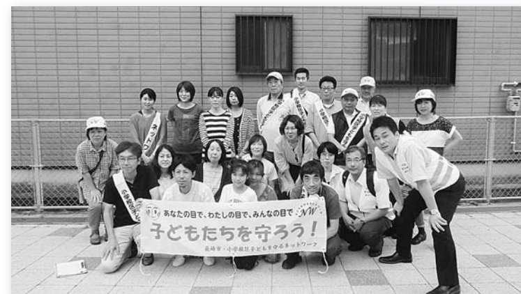
地域の子どもたちを守ろう!「子どもを守るネットワーク」