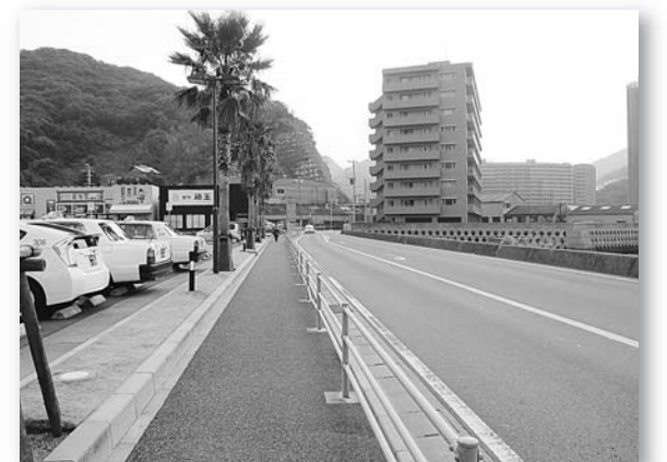
国道202号(大浜町~福田本町)拡幅整備!