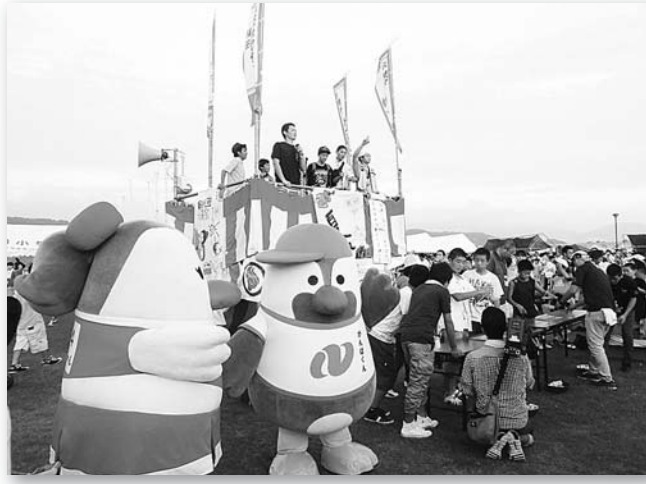
第19回福田夏祭り(H26.7.19 長崎サンセットマリーナ)