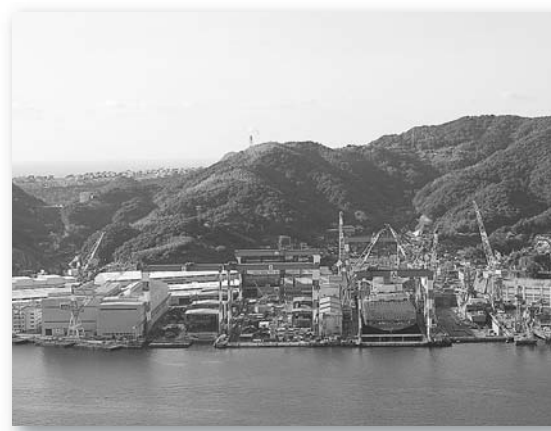
長崎県の基幹製造部門!造船業の継続に向けて!!